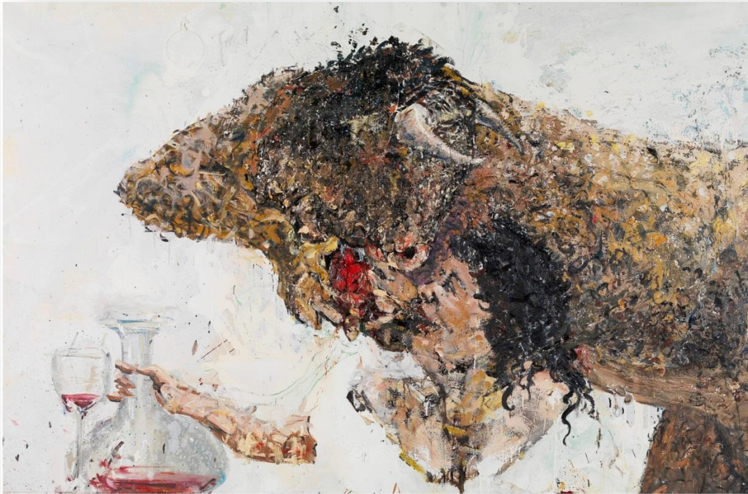
Fabian Cerredo, Minotaurus bietet seiner Schönen sein Herz an, 2003 © Bildrecht, Wien 2017, Fonds de l'Abbaye d'Auberive