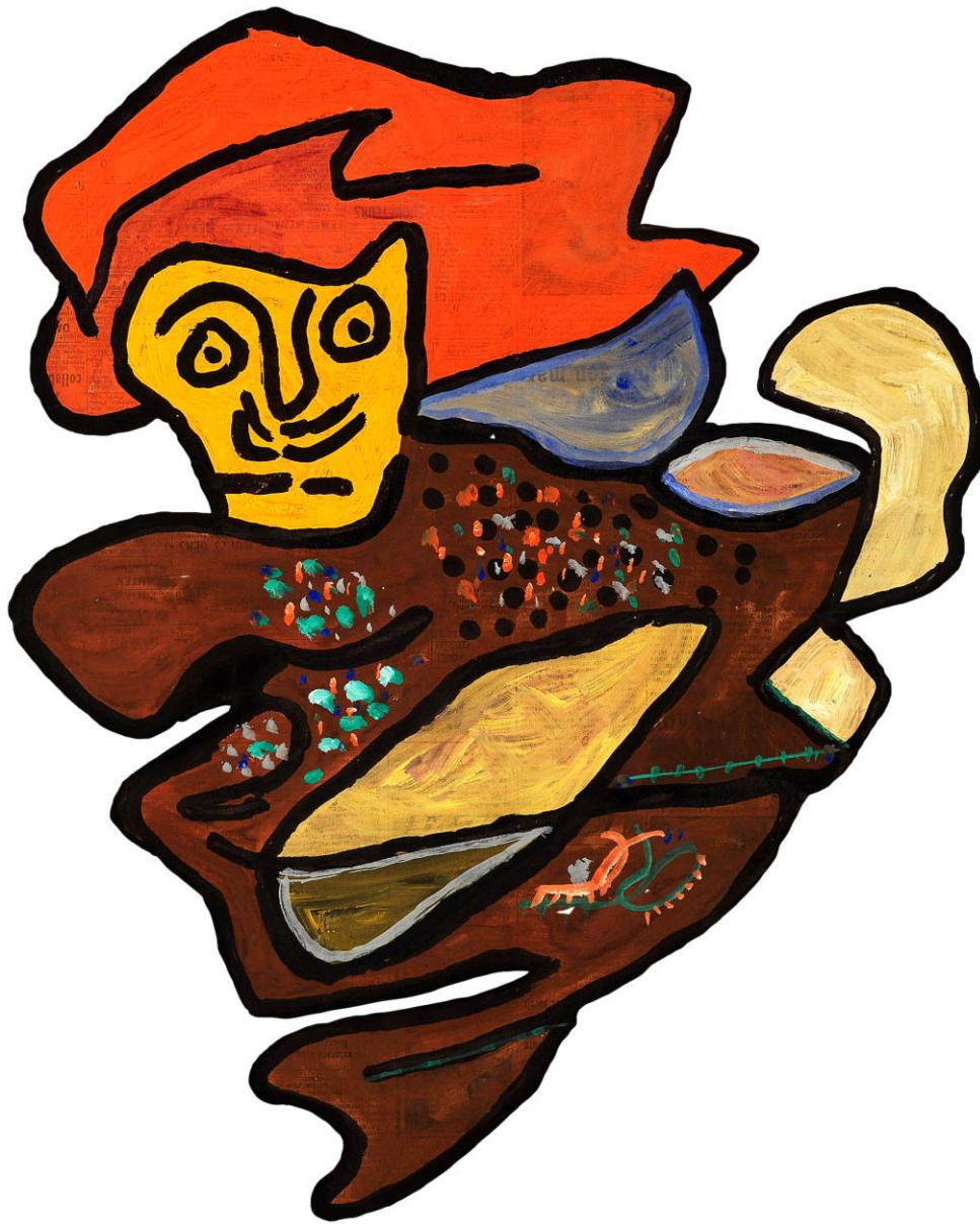
Gaston Chaissec, Ohne Titel, ca. 1960